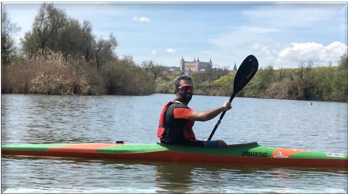
Foto tomada bajando hacia Toledo desde el puente de Azucaica (RÍO TAJO 2022)